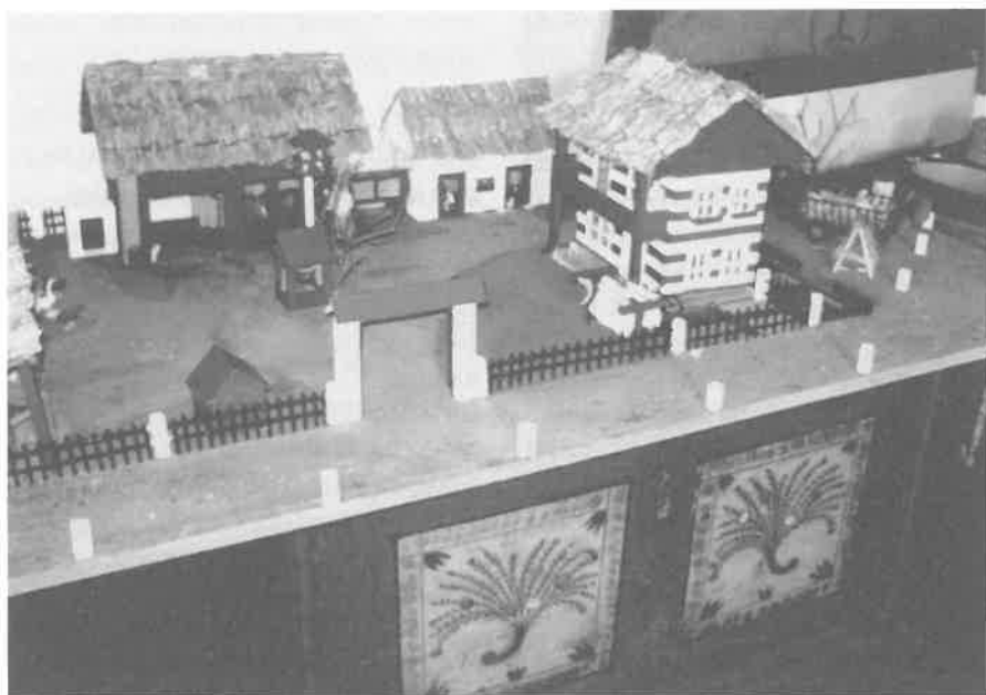
Model lidového statku - autoři žáci ZŠ Sobotka

v Českém ráji, jejíž slavnostní zahájení se uskutečnilo 15. 8. 2014.