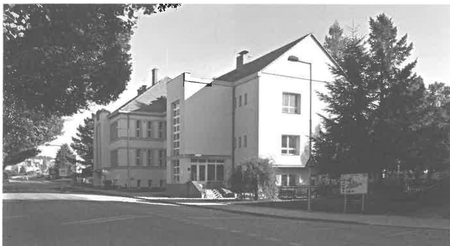
MŠ Sobotka

ské ulici ho nelze rozšířit. Nebude tedy možné na jeho rekonstrukci získat dotaci a oprava tak bude realizována pouze z finančních prostředků města. Zároveň s tím se počítá i s úpravou ze-