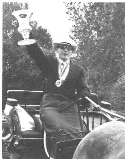
Představujeme Vám Mistra České republiky v párech pony

Prošel jsem celou řadu stájí v okolí Jičína,